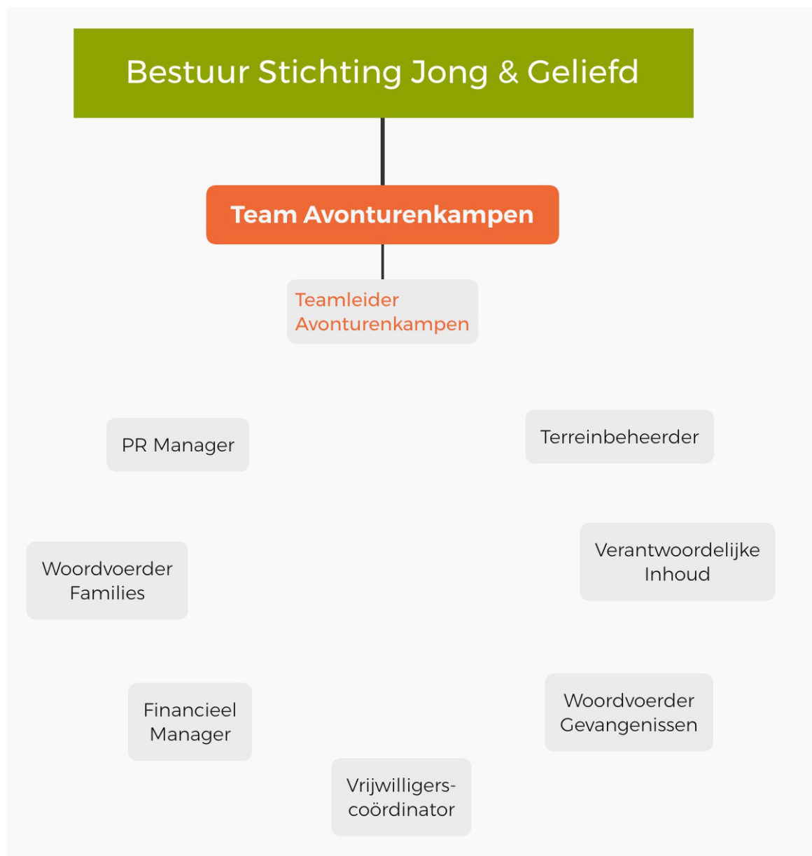
Organisatieschema kernteam Jong & Geliefd Avonturenkampen

De organisatie is verdeeld in drie eenheden: ten eerste het bestuur van de stichting als opdrachtgevers. Er wordt hier in dit document niet verder op ingegaan wegens irrelevantie, meer informatie hierover vindt u in het meerjarenbeleid van de Stichting zelf. Ten tweede het Kernteam Avonturenkampen, dat verantwoordelijk is voor de voorbereiding en planning van het Jong & Geliefd Avonturenkamp. Ten derde het kampteam, dat verantwoordelijk is voor de uitvoering van het kamp. De leden van het kernteam Avonturenkampen kunnen functies in het kampteam overnemen.